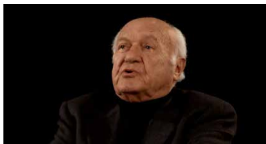
Pierre Nora témoigne comme enseignant en Algérie (Oran) entre 1956 et 1959 dans le webdocumentaire de Réseau Canopé «L'Algérie et son école, les mémoires en question»,

De cette exposition présentée à Rouen ont été tirés une exposition itinérante et un webdocumentaire qui circulent dans les établissements scolaires et auprès des collectivités territoriales. À la demande du rectorat de Rouen, ils ont servi aussi de supports de formation auprès d'enseignants d'histoire-géographie.