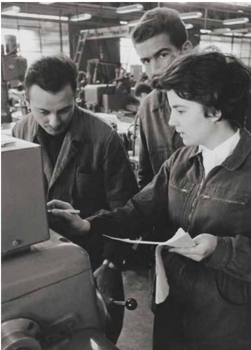
Fonds photographique IPN : cahier n° 90. Tour de France de 90 lycéennes dans une usine Renault, 1964.