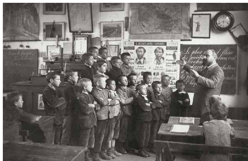
Leçon d'anti-alcoolisme dans le Pas-de-Calais. Tirage original réalisé pour l'Exposition universelle de 1900.