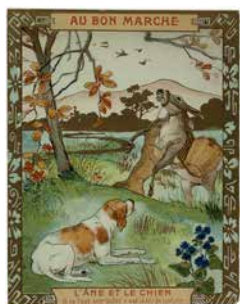
Carte réclame. Au Bon Marché. Fables de la Fontaine , vers 1930.