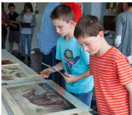
Élèves de 5° en posture de chercheurs lors de l'animation « Carnets de voyage », dans la salle d'étude du musée.