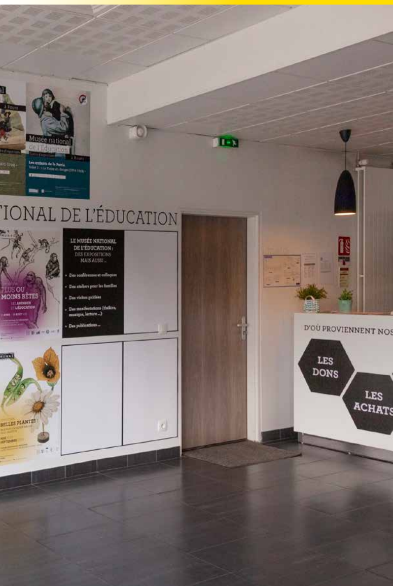
Hall d'accueil du centre de ressources du musée, affiches des expositions depuis 2012.