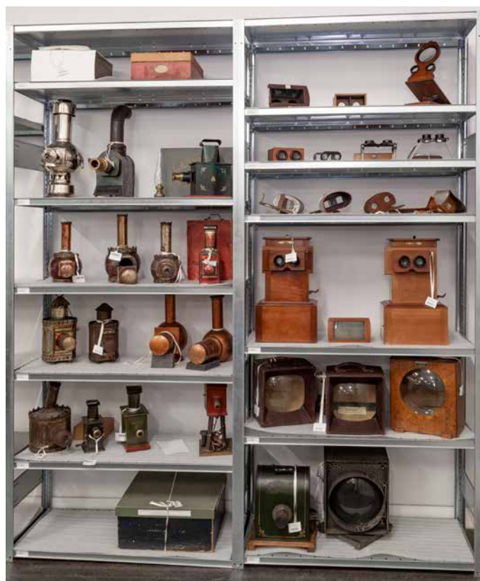
Réserve des appareils de projections dont des lanternes magiques, centre de ressources du Munaé.

Elles s'illustrent par les typologies d'œuvres et documents patrimoniaux suivantes :