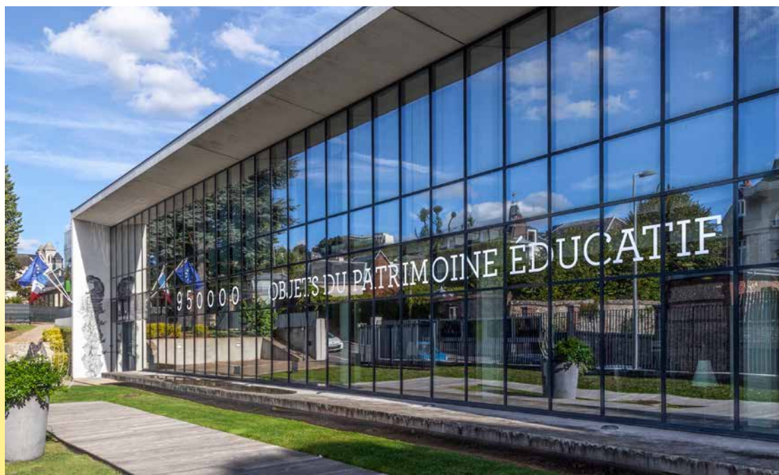
Centre de ressources du Munaé, 6 rue de Bihorel Rouen, 2018.

Depuis la mise en place de son projet scientifique et culturel (2013-2018), le Munaé connaît une hausse spectaculaire de sa fréquentation, passant de 8 235 visiteurs en 2013 à 21 721 en 2018 . Cette évolution est notamment à mettre en rapport avec la mise en place d'un service des publics et d'une programmation dynamique, ainsi qu'avec une programmation d'expositions renouvelée.